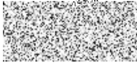
provozní ředitel PRAHA 10 - Majetková, a.s.