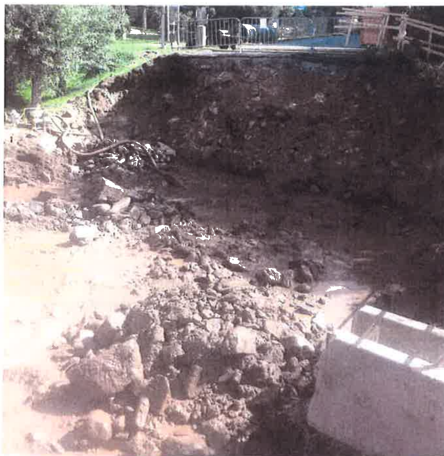
Ve výkopu odkryté kameny a balvany granodioritu.