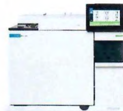
Obrázek 1: Agilent 8890

Plynový chromatograf Agilent 8890 je výsledkem více než 40 let výzkumu, vývoje a zkušeností americké společnosti Agilent Technologies na poli plynové chromatografie. Inovovaný plynový chromatograf Agilent 8890 patří do rodiny GC systémů, které staví na základech robustních, velmi oblíbených a stále používaných modelů HP 4890 , HP 5890 , Agilent 6890 a Agilent 7890 . Pokročilé technologie, jež zahrnují např. webové rozhraní nebo diagnostické nástroje, převzal GC systém 8890 od modelu Agilent Intuvo.