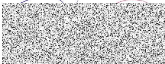
starosta města Vsetín