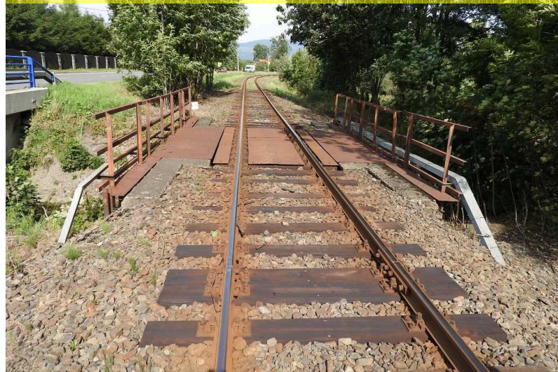
SO 04 Pohled zprava