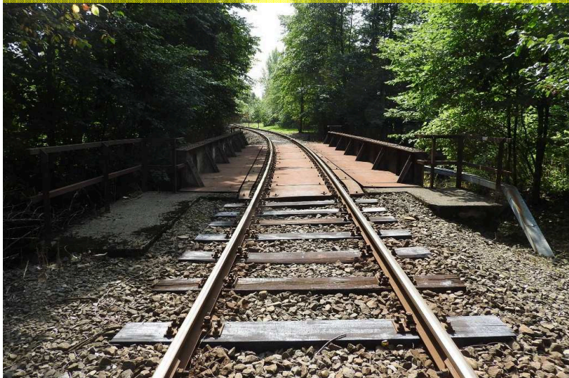
SO 03 Pohled zleva