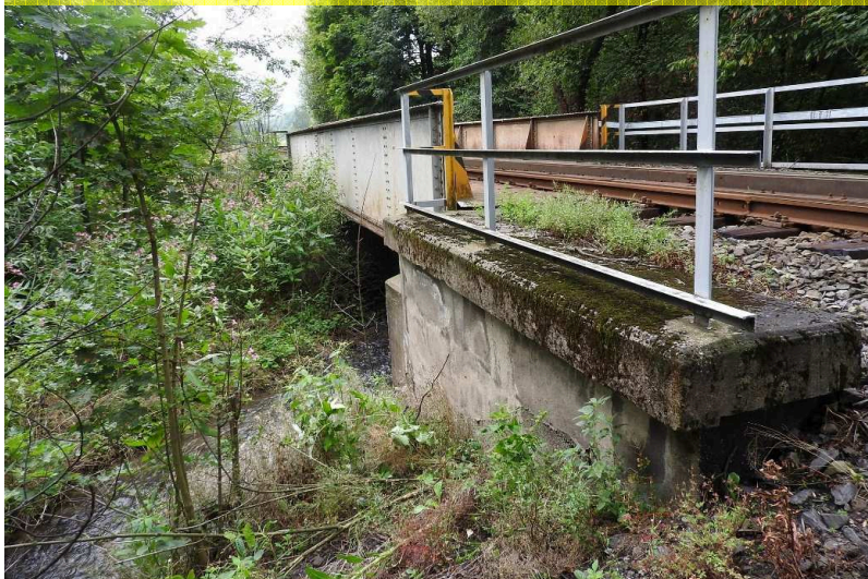
SO 01 Pohled zleva