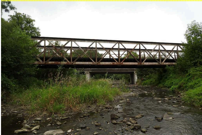
SO 02 Pohled zleva