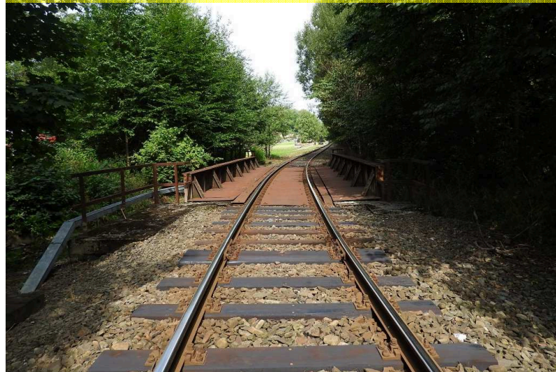
SO 03 Pohled zprava