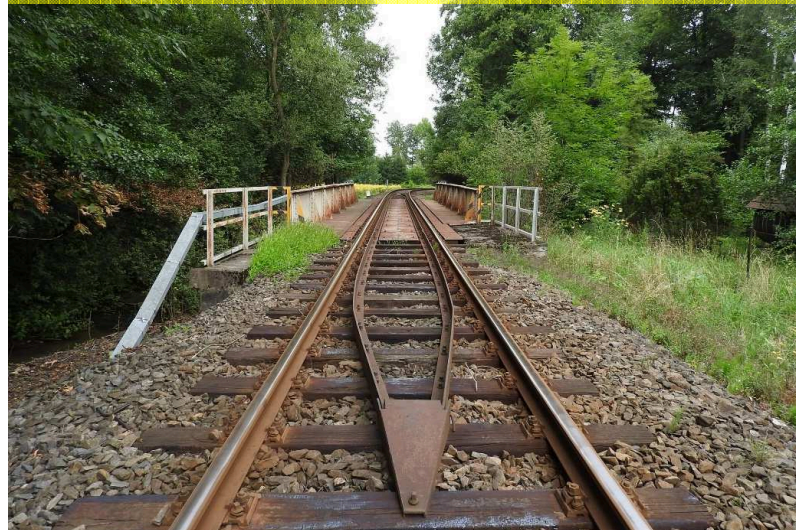
SO 01 Pohled zprava