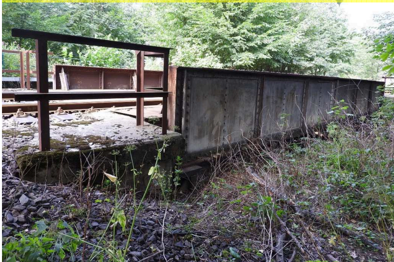
SO 03 Pohled zleva