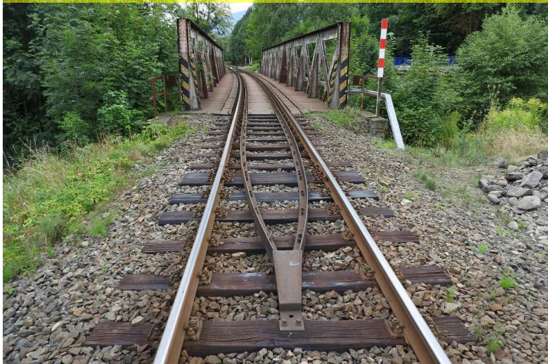
SO 02 Pohled zleva