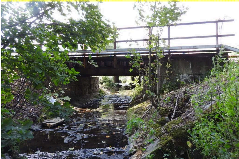
SO 04 Pohled zleva