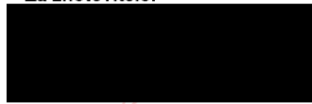
OSP, spol. s r.o. jedenatel