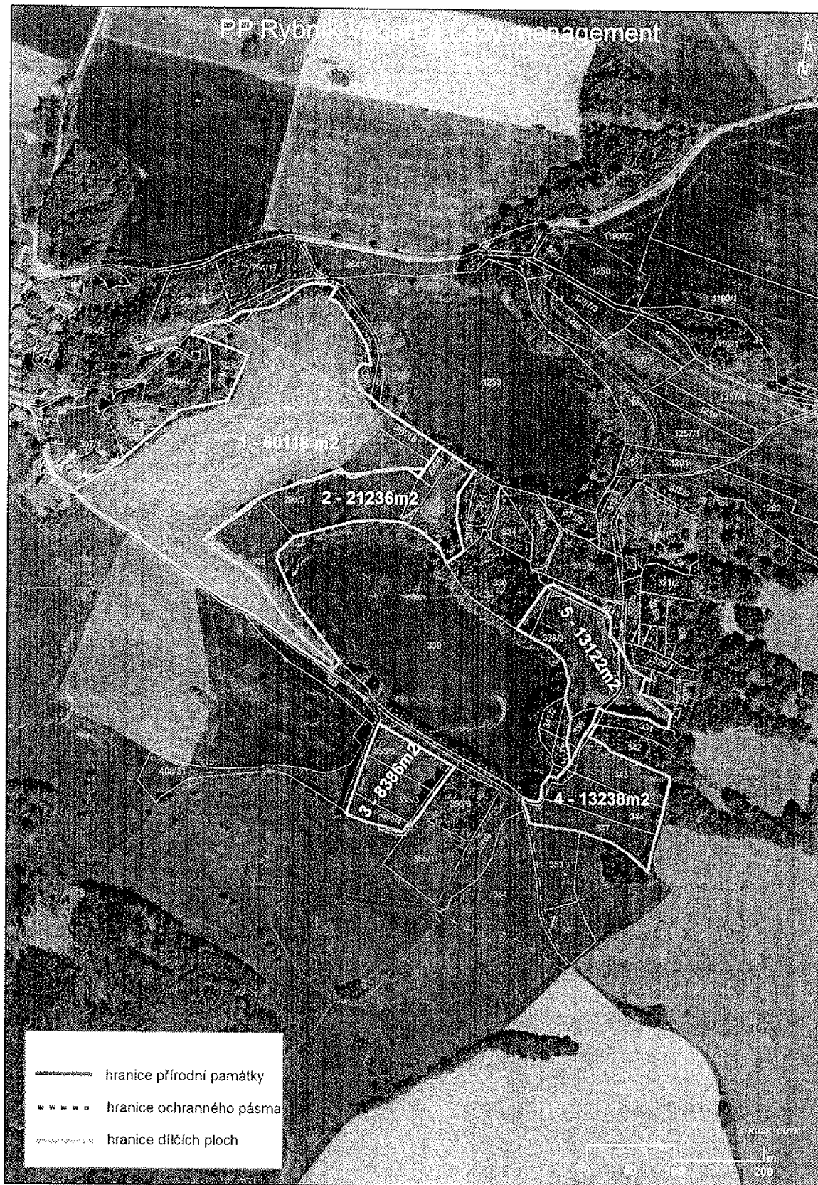
Příloha č 2: