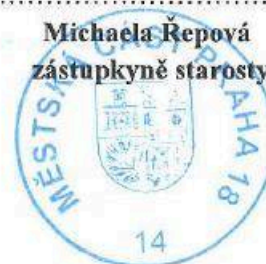
Michaela Řepová zástupkyně starosty