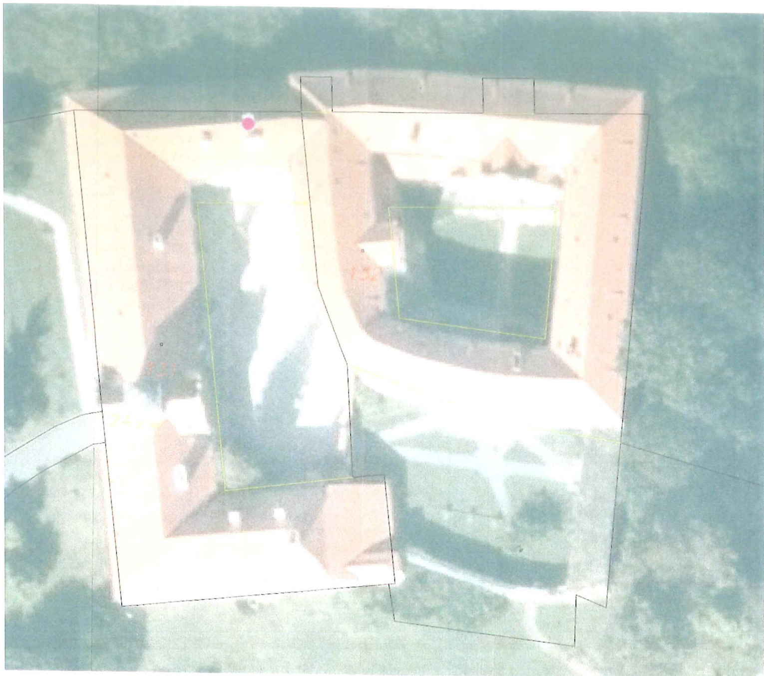
umístění antény na střeše budovy Nového zámku