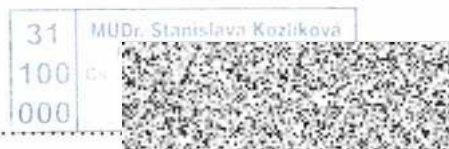
Razítko a podpis