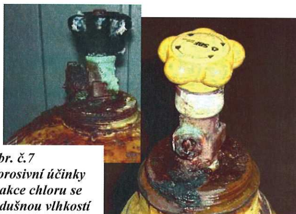
Obr. č.7 Korosivní účinky reakce chloru se vzdušnou vlhkostí

Odběratel kapalného chloru má za povinnost mít u sebe dostatečný náhradní počet těchto závěrných matic, které může použít v případě, že dojde k její ztrátě či poškození na ventilu chlorové lahve či sudu.