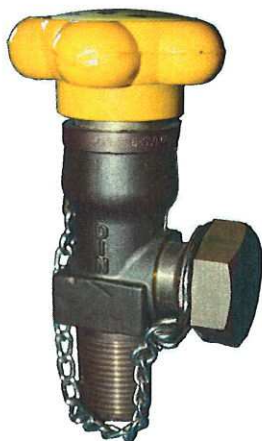
Obr. č.6 Chlorový ventil dodávaný společností GHC Invest s našroubovanou bezpečnostní těsnicí maticí na připojovacím závitě ventilu

Na připojovacím závitě každého ventilu musí být našroubovaná a utažená závěrná, bezpečnostní těsnicí matice.