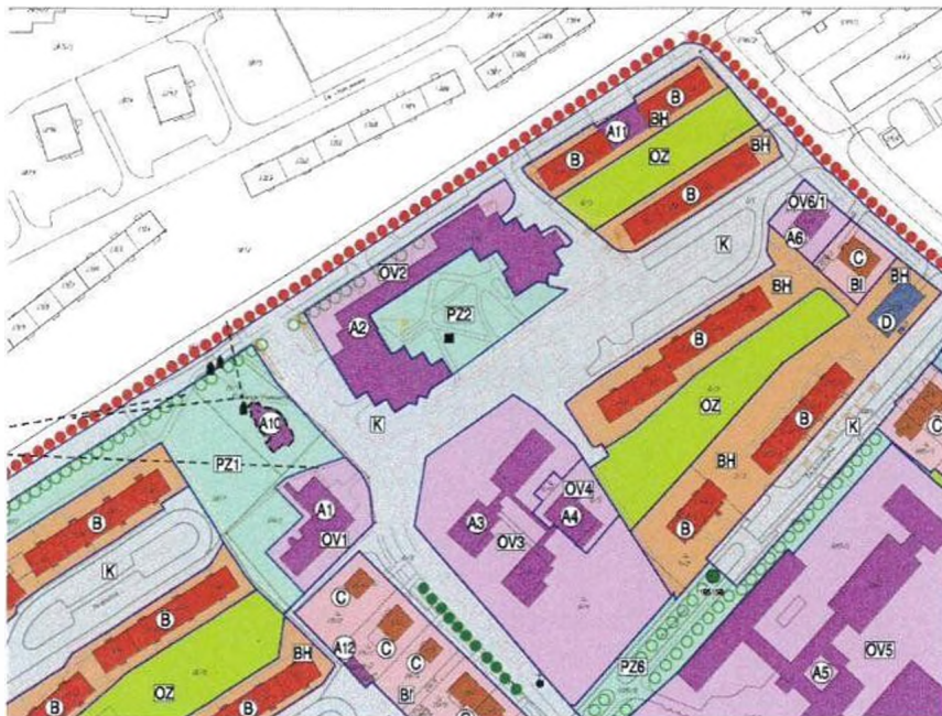
výřez hlavního výkresu RP-21 Brněnská

Pro plochu PZ2 je dále upřesněna podmínka respektovat hlavní osu kolmou na ulici I.P.Pavlova s optickým propojením chodníku podél ulice I.P.Pavlova do centra plochy zeleně.