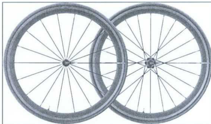
Obr. 1 – ilustrační obrázek – Pár karbonových silničních kol

Pár karbonových silničních kol MavicCosmic Pro Carbon SL UST 2020. UST systém (včetně tmelu) je o 40 g lehčí než tradiční pláště s duší. Aero ráfek s profilem NACA má nízký aerodynamický odpor a vylepšenou stabilitu při bočním větru. Vnější šířka ráfku je 25 mm pro lepší spojení mezi ráfkem a pláštěm a zlepšuje ovladatelnost za všech podmínek. Patentované eliptické dráty vylepšují aerodynamiku.