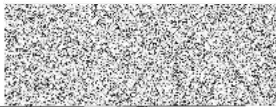
ČEZ Distribuce, a.s. Budoucí oprávněná