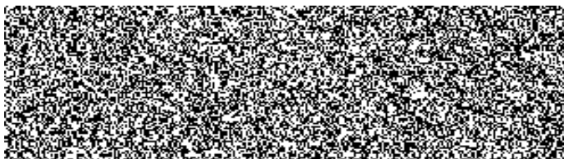
Petronela Rosová Specialista zákaznických služeb III