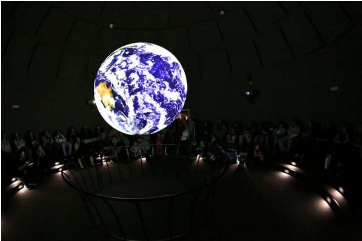
Obr. 1: Ilustrační obrázek sálu s Vědou na kouli

Projekt „Věda na kouli“ neboli Science on a Sphere (SoS), který vznikl v roce 2007 na základě myšlenek vědce Dr. Alexandra MacDonalda z NOAA (Národní úřad pro oceán a atmosféru), patří mezi nejpozoruhodnější inovace v oblasti vzdělávání obecně. Sférické výsledky týkající se měření nejrůznějších jevů na celé zeměkouli se prezentují na fyzické kulové projekční ploše znázorňující Zemi, kterou je možné přirozeným způsobem obcházet, zkoumat, prohlížet a ovládat. Po celém světě tak vznikají jakási sférická kina, která nakonec mají daleko širší uplatnění než jen pro NOAA. Projekt Science on a Sphere patří mezi nejpozoruhodnější inovace v oblasti vzdělávání. Obsah je k dispozici široké veřejnosti.