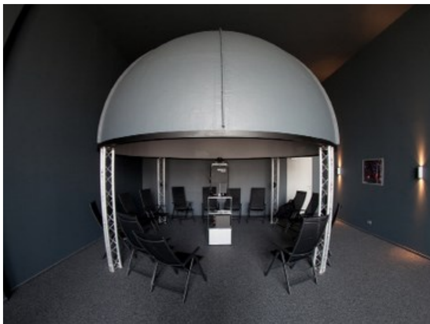
Obr. 2: Ilustrační obrázek digitária