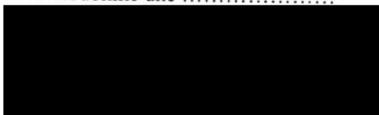
Libor Střecha starosta města