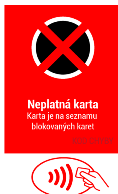
Obrázek 4.3: Blokována UL karta