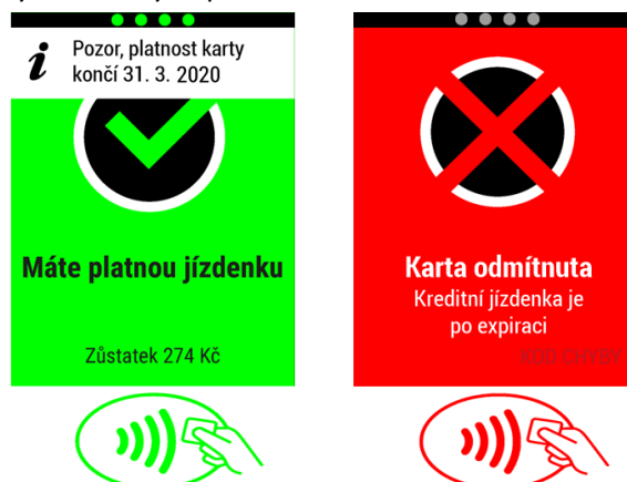
Obrázek 4.2: UL karta blížící se konec expirace karty a po expiraci karty