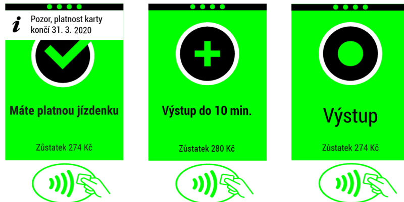
Obrázek 4.1: CI/CO do 10 min./CO nad 10 min.

Při odbavení karty na CI/CO je zobrazen zůstatek elektronické peněženky v bluelistu EP.