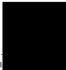
předseda ČBS za pověřeného