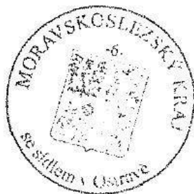
FIGURA - UVEDENÉK s.r.l. Číslo účtu: 25110000000000000000 www.figura.cz