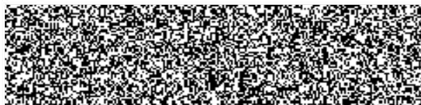
náměstek ředitele krajského ředitelství pro ekonomiku