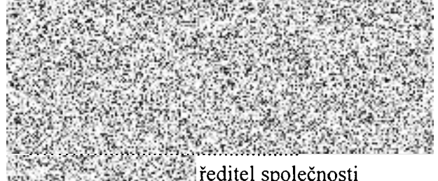
ředitel společnosti (oprávněn na základě plné moci) Silnice Klatovy a.s. (zhotovitel)