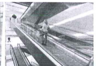
Eskalátory & pohyblivé chodníky