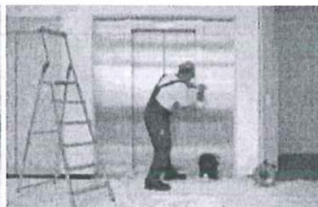
Servis 24 hodin