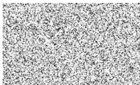
p r o n a j í m a t e l