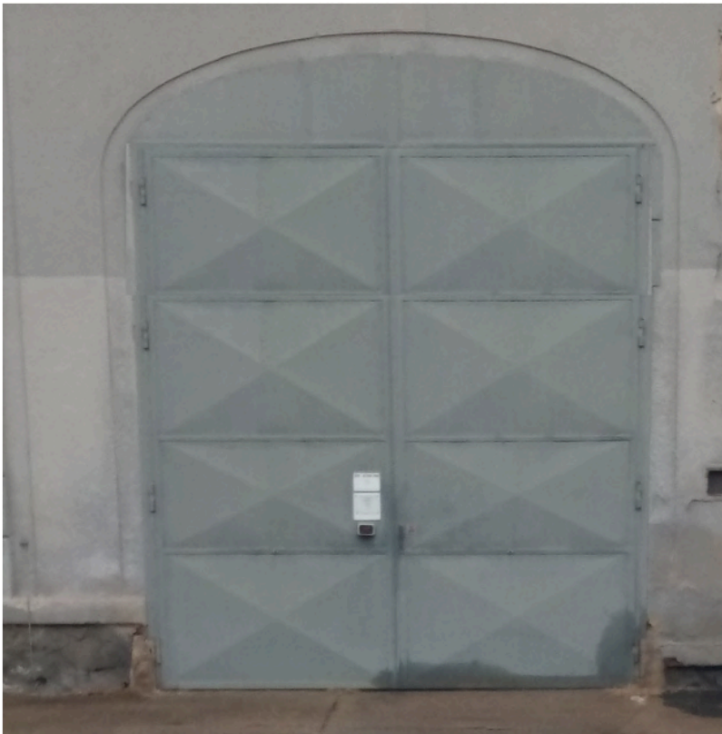
Orientační představa nového stavu