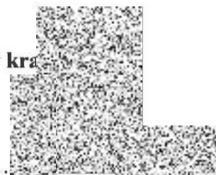
Martin Hejman radní pro oblast investic a veřejných zakázek