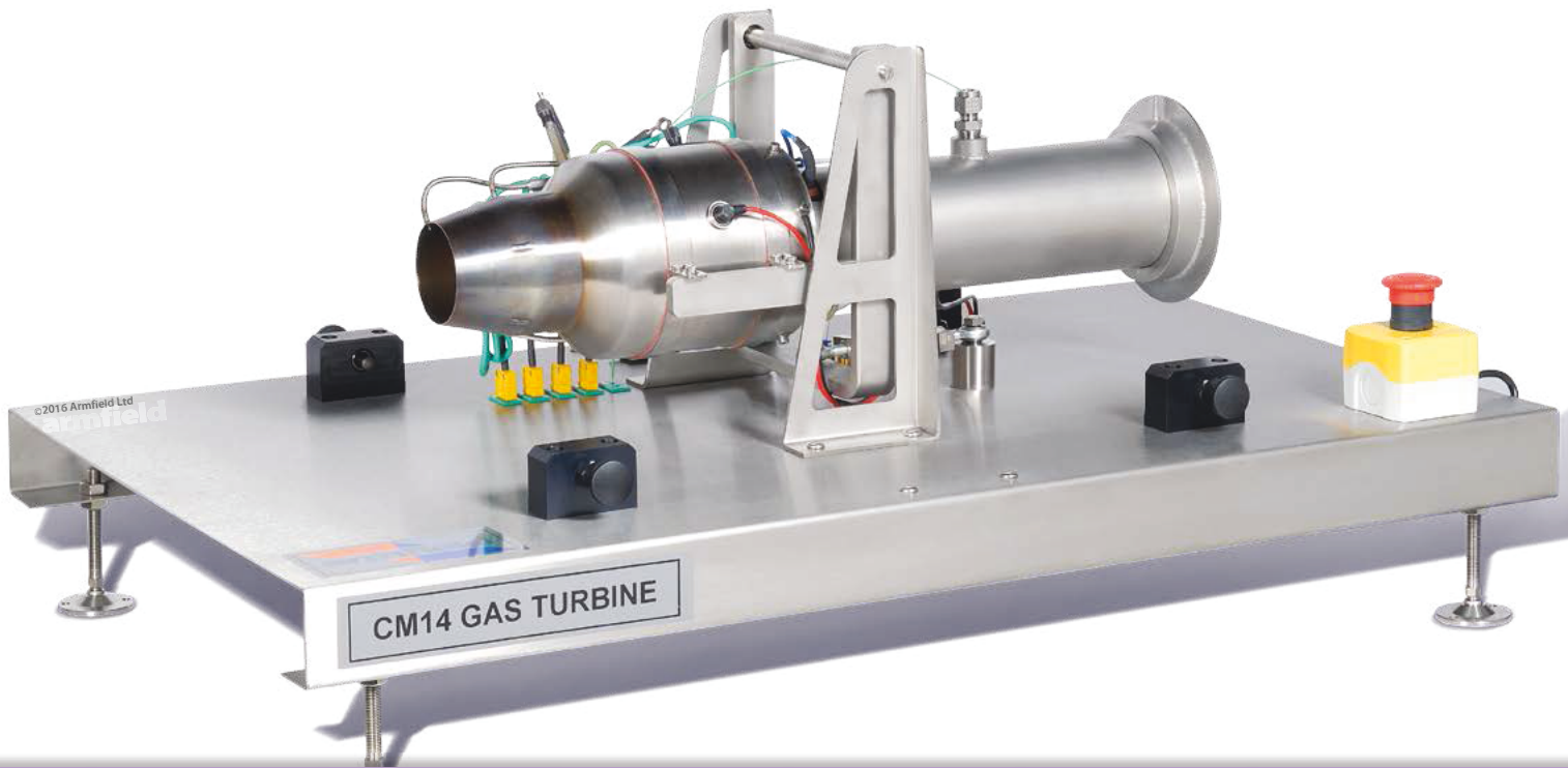
CM14 frame-mounted version. Shown with cover removed for clarity

NEW IMPROVED STARTING SYSTEM – NO NEED FOR PROPANE GAS OR COMPRESSED AIR