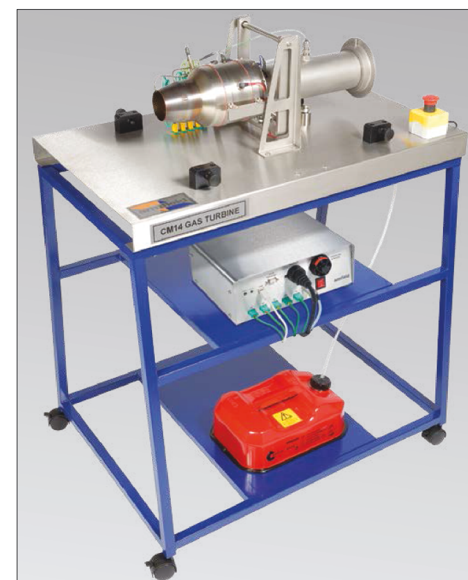
CM14 frame mounted version. Shown with cover removed for clarity