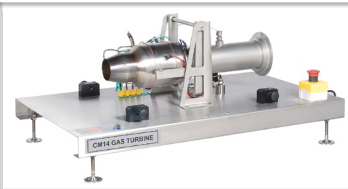
CM14 benchtop option. Cover removed for clarity