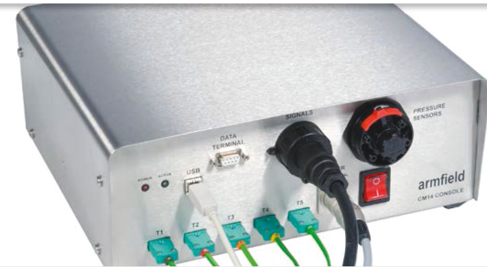
CM14 console detail