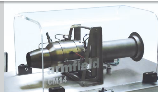
CM14 with safety screen in place