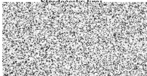
Martin Draxler radní pro oblast regionálního rozvoje, cestovního ruchu a sportu