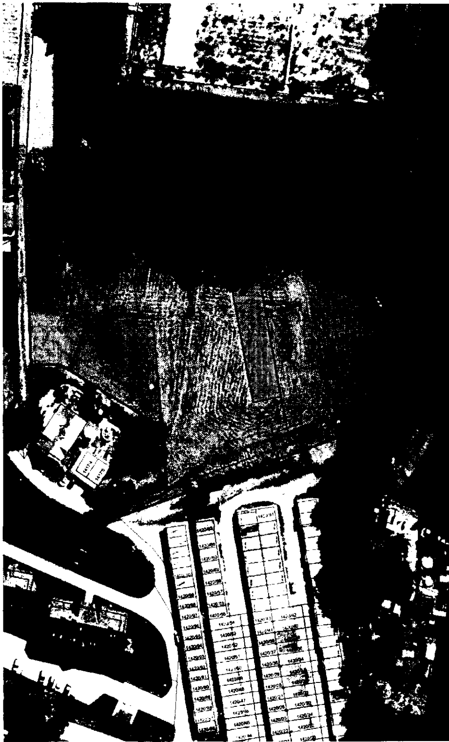
Situace Lokalita 2 (k. ú. Jilemnice)