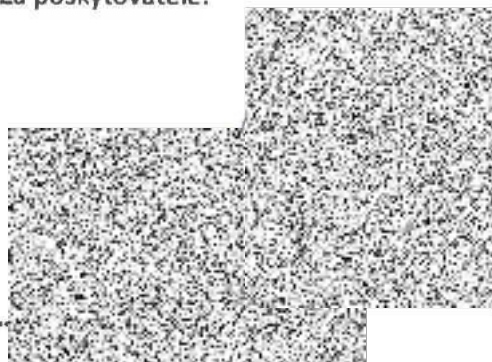
starosta města Vsetín

Ve Vsetíně dne ...19...02. 2020 Za poskytovatele: