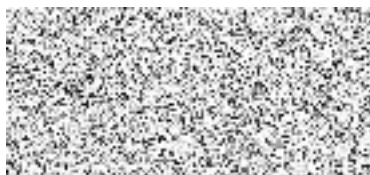
osoba oprávněná jednat za zhotovitele