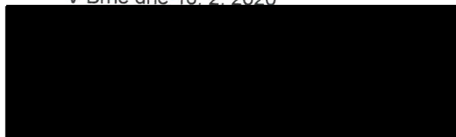
Electric Medical Service, s.r.o.