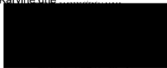
ASTRA kancelářské potřeby s.r.o. jednatelka