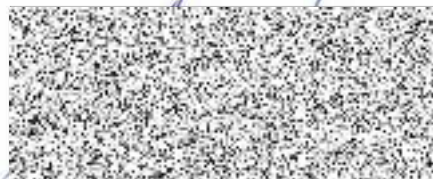
Petr Červenka starosta města Meziboří