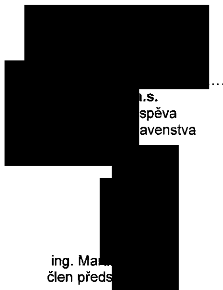
ing. Malý člen předsedy