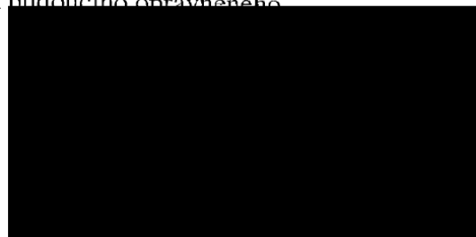
Dopravního podniku města Brna, a.s.

V Brně dne ..... Za budoucího oprávněného