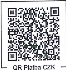
QR Platba CZK

V ceně zboží je zahrnut recyklační poplatek a autorské odměny v zákonné výši. Další informace Vám rádi sdělíme na naší provozovně.