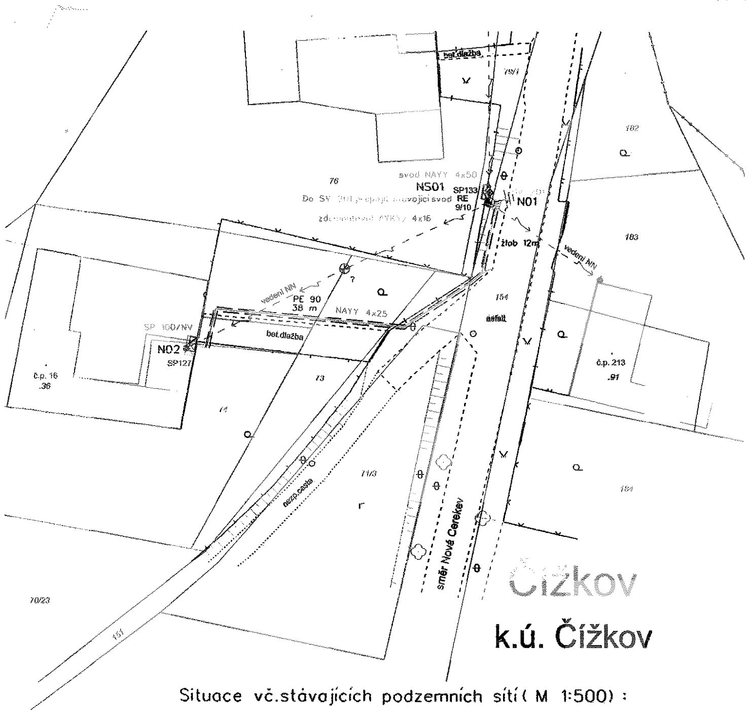
Situace vč. stávajících podzemních sítí ( M 1:500 ) :

Projektant Pavel Babický (Kilowatt, Dvorská 517, 396 01 Humpolec) vypočetl předpokládanou náhradu za věcné břemeno na základě ceníku Kraje Vysočina, platného v době uzavírání Smlouvy o budoucí smlouvě o zřízení věcného břemene a předpokládaného rozsahu a formy zásahu takto: