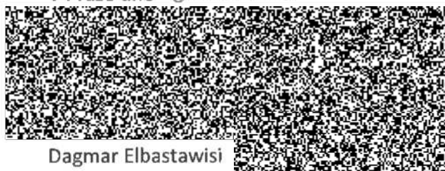
Dagmar Elbastawisi Senior manažer licenčního kompetenčního centra, na základě pověření