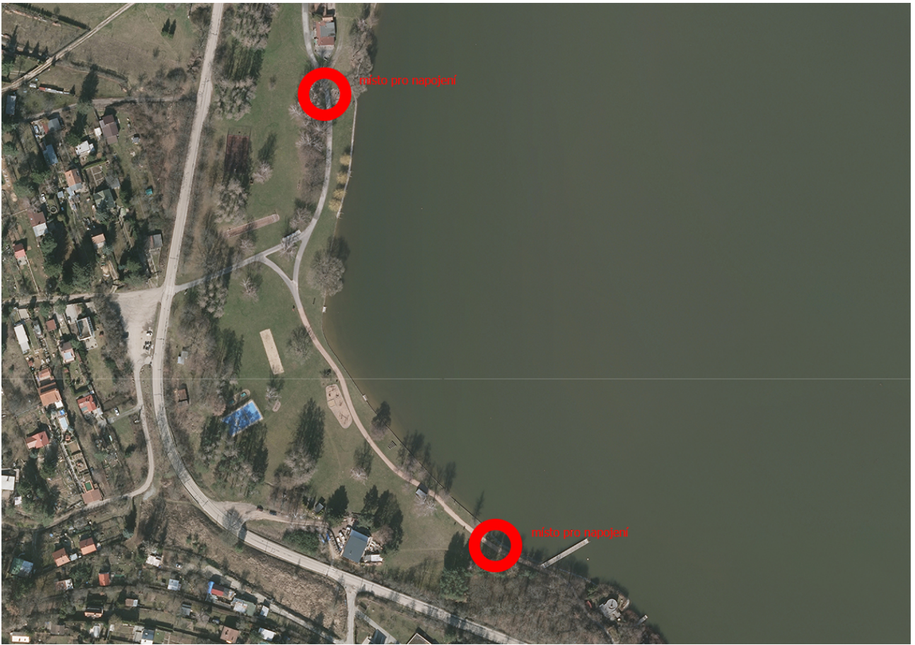
lokality Kozí horka