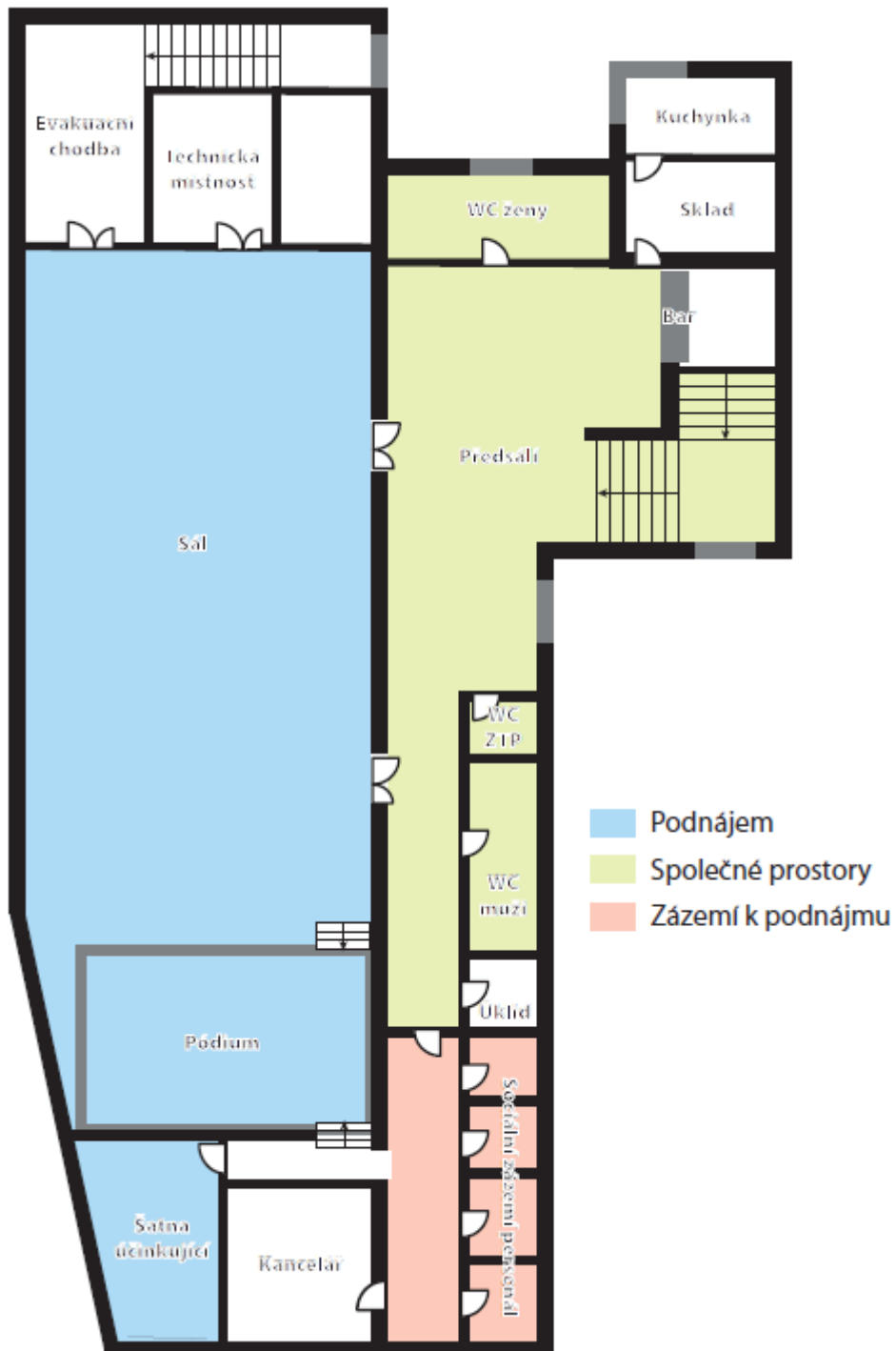
Schéma předmětu podnájmu: