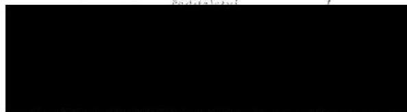
ředitel Fakultní nemocnice Hradec Králové