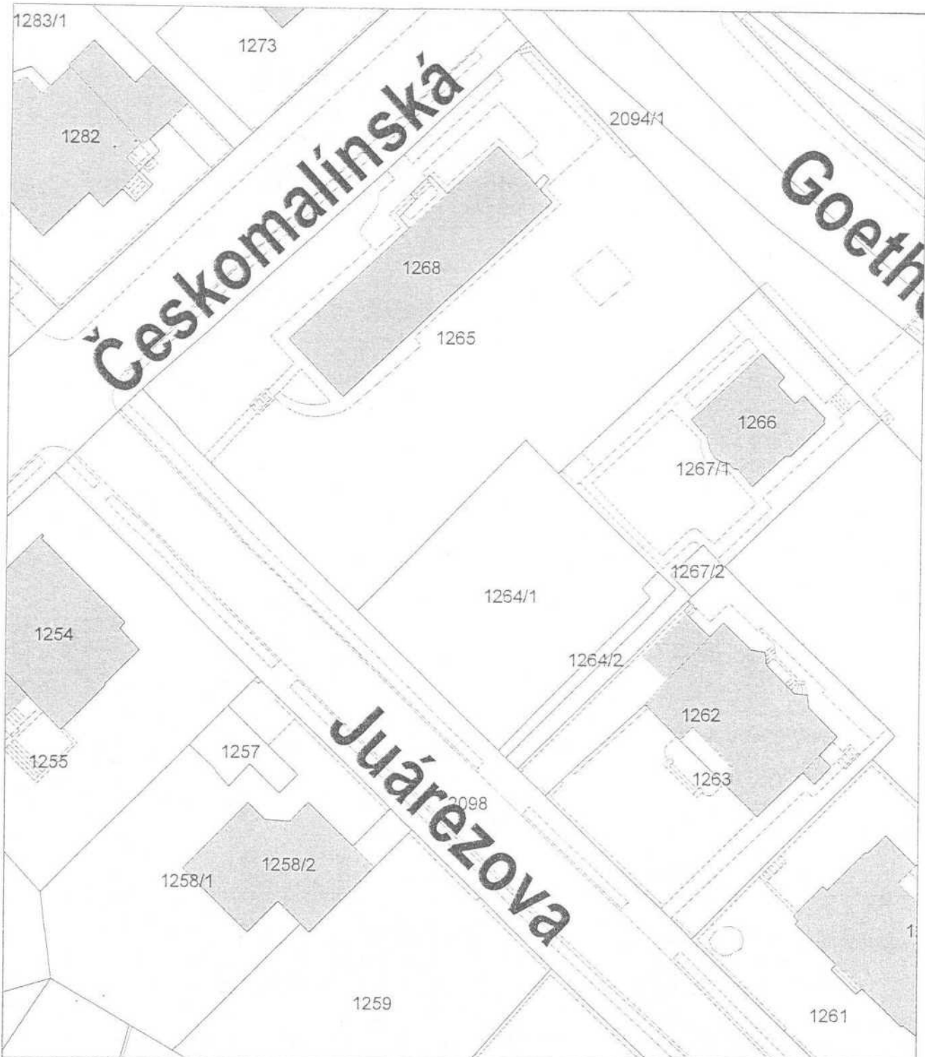
Mapa v měřítku 1:625

Budova č. p. 1037 v k. ú. Bubeneč – počet podlaží: 3