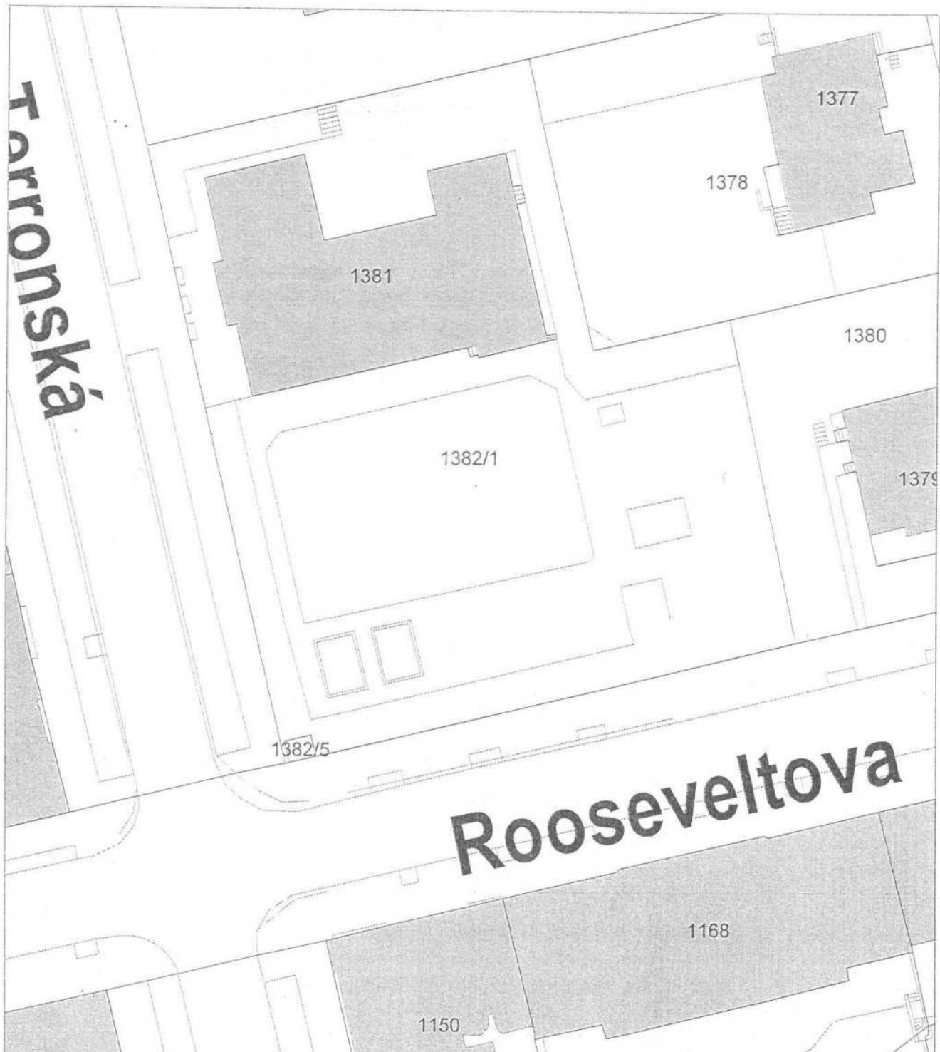
Mapa v měřítku 1:588

Budova č. p. 200 v k. ú. Bubeneč – počet podlaží: 4