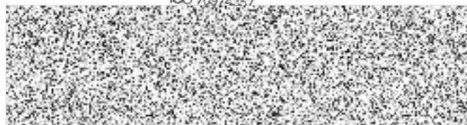
Základní umělecká škola výpůjčitel

ZÁKLADNÍ UMĚLECKÁ ŠKOLA KUTNÁ HORA příspěvková organizace Vladislavova 376, 284 01 KUTNÁ HORA IČO 70974357