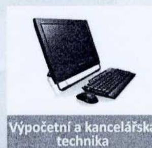
Výpočetní a kancelářská technika