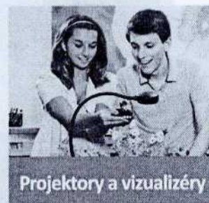
Projektory a vizualizéry