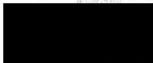
major Teunis T. Scholtens národní velitel

Armáda spásy v České republice, z.s. Přítkova 2565/23 100 00 Praha 5, IČ: 40613411