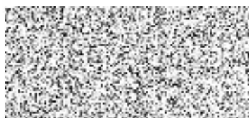
Jednatelka společnosti MSS-projekt s. r. o.