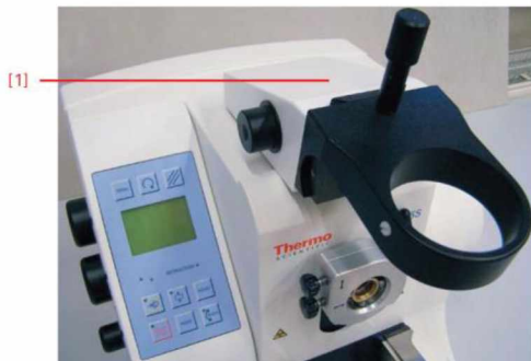
Figure 90. Adapter for Stereomicroscope