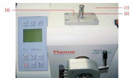
Figure 92. Adapter for Stereomicroscope and Large Field Magnifier