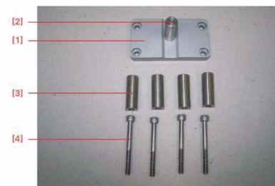
Figure 91. Accessories for Stereomicroscope and Large Field Magnifier