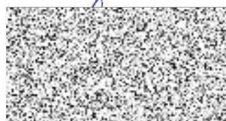
Divadlo v Lidovém domě z.s. předseda spolku